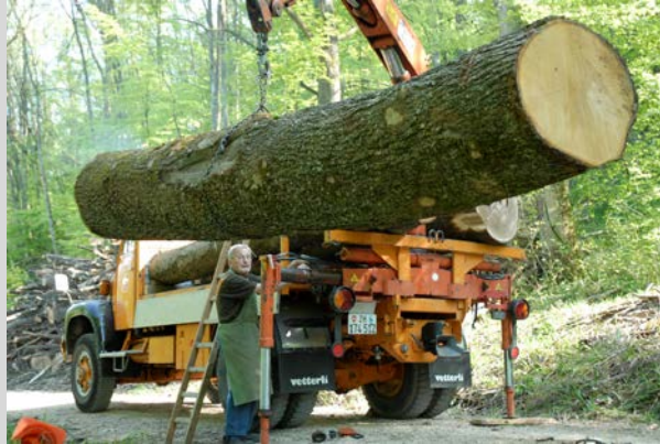
Reformierte Kirche Kanton Zürich – Nachhaltige Beschaffung in Kirchgemeinden?