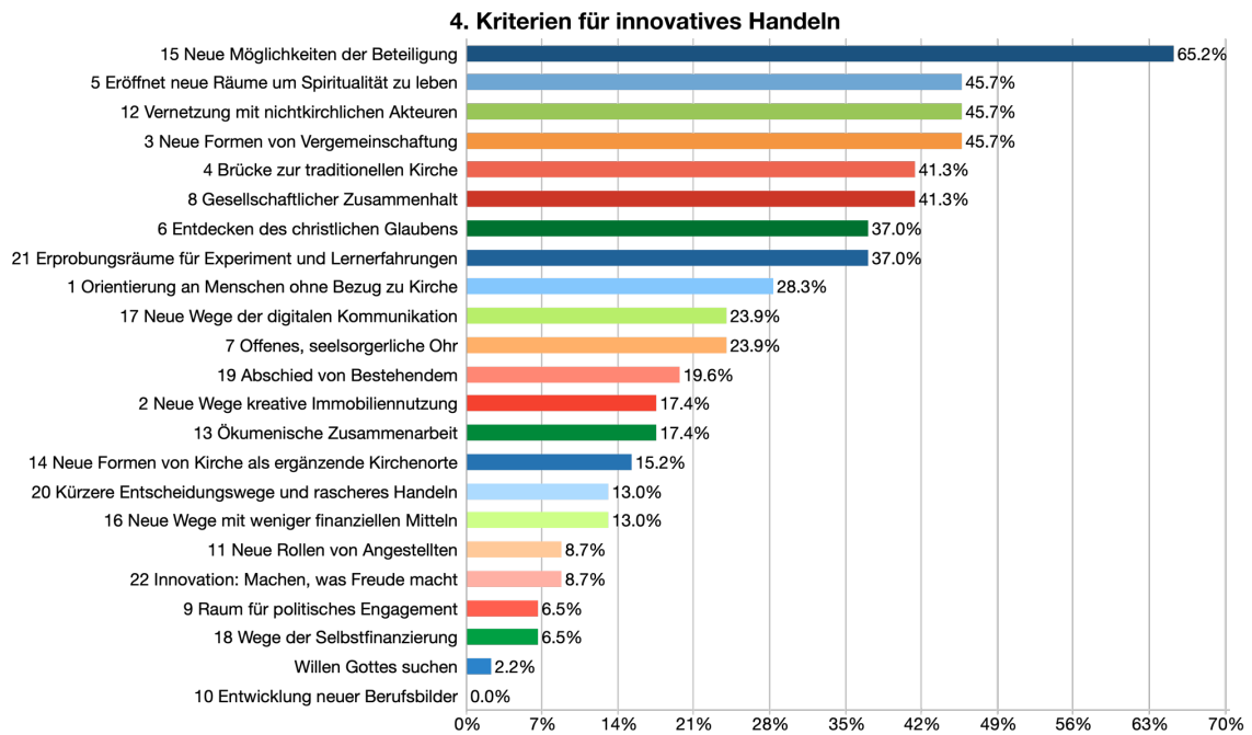
Abbildung 2: Kriterien für innovatives Handeln

Während einige der genannten Kriterien in den von den Kirchgemeinden erwähnten Projekten klar erkennbar sind (Beteiligung, Spiritualität, Gemeinschaft) und andere möglicherweise den Besonderheiten der Corona-Pandemie zuzuschreiben sind (Zusammenhalt der Gesellschaft), können einige auch als handlungsleitende Absicht erklärt werden, da sie weniger oft in den erwähnten Projekten erkennbar sind (Vernetzung mit nichtkirchlichen Akteuren). Interessant ist auch das oft genannte Kriterium der Brücke zur traditionellen Gemeinde, welches deutlich öfter benannt wird als das Kriterium, neue Formen von Kirche als ergänzende Kirchenorte zu schaffen. Die Kriterien und deren Beurteilung lässt nur Tendenzen und assoziative Einschätzungen zu. Für ein tieferes Verständnis und Erforschung eben genannter Hypothesen bräuchte es weitere Befragungen.